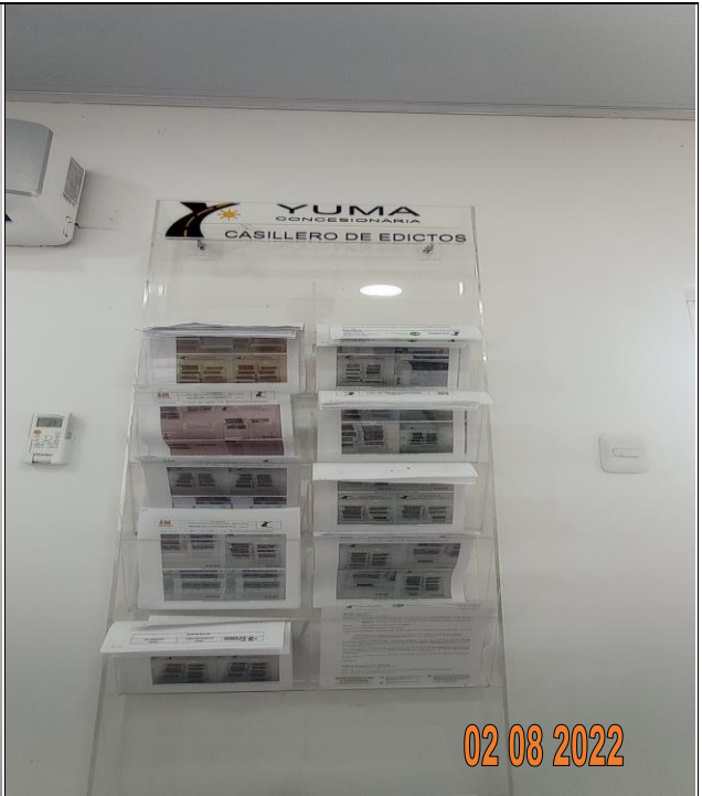
EDICTO R_34898 YC-CRT-117014